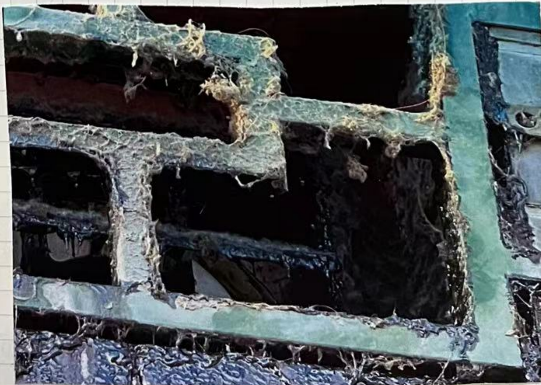
油烟冒出来的窗户有许多不明菌丝 和藻类。