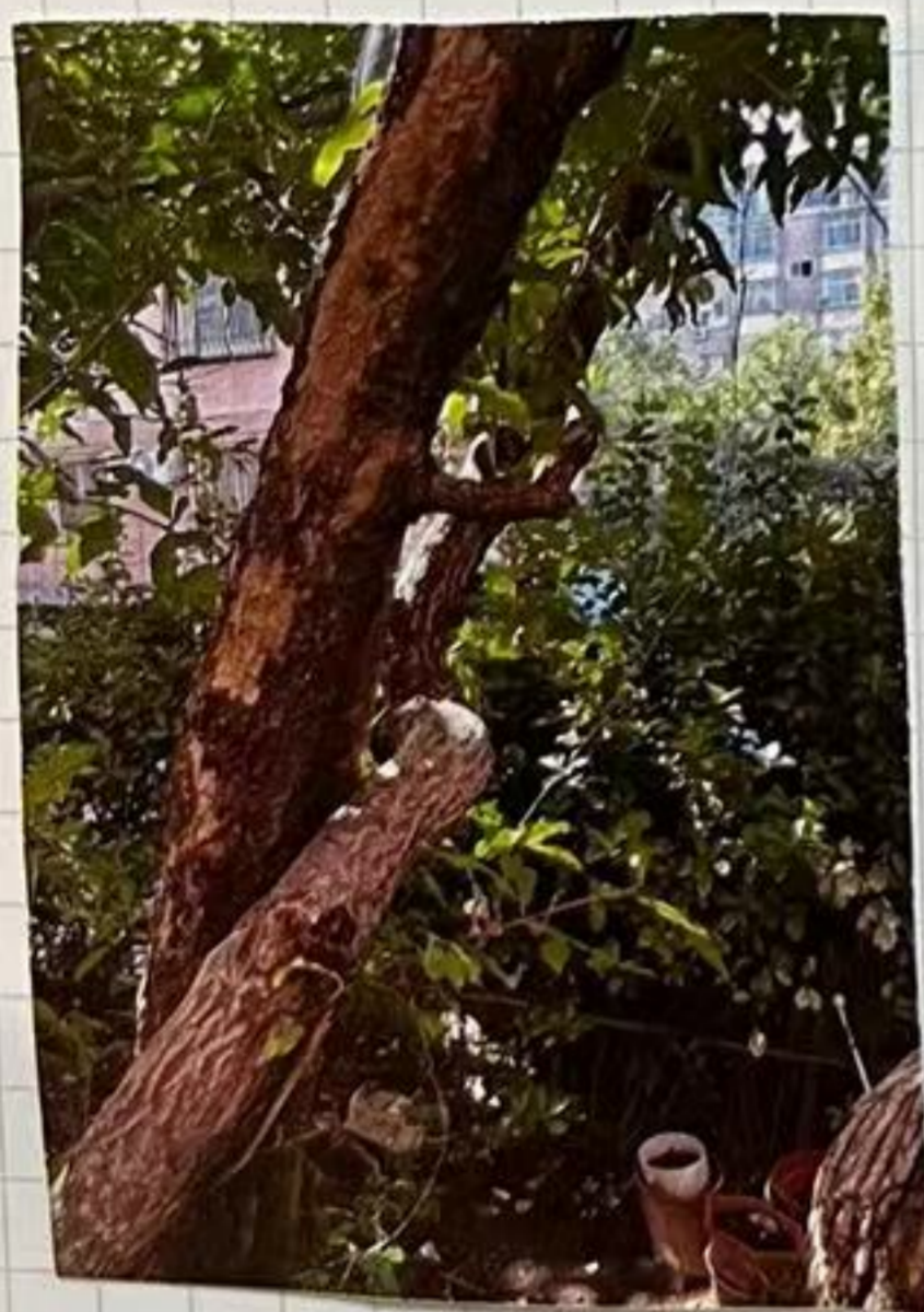
石榴树和木枣树 嫁接在一起了 同一块地上。