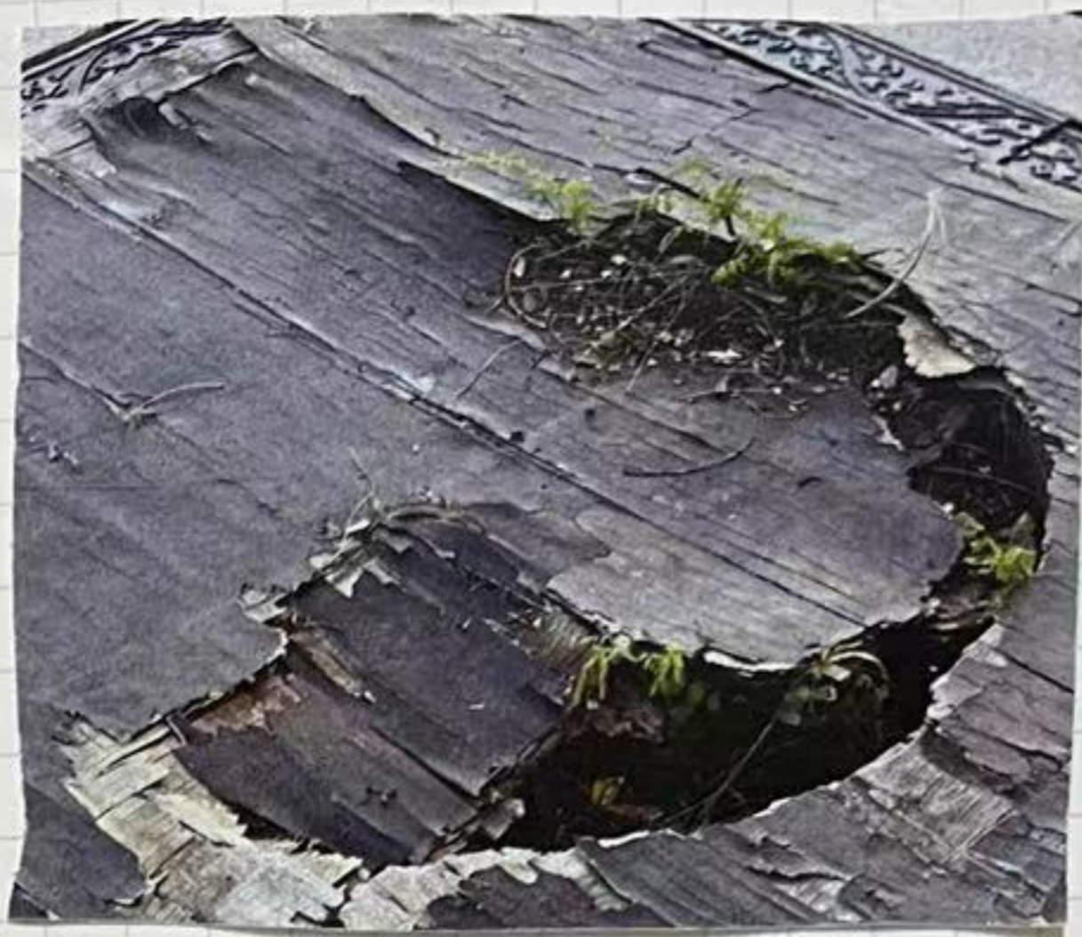
被踩得昏坏了的地板长出了草