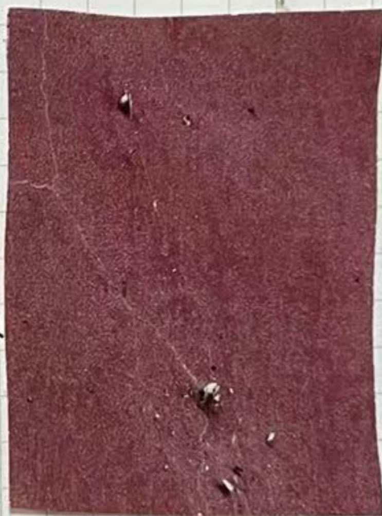
蜗牛 + 蜘蛛