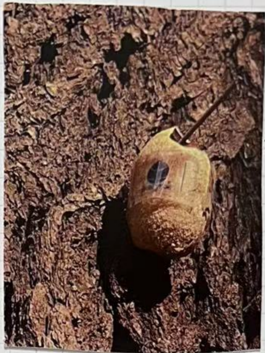
不知道 谁挂的 蛾子茧.