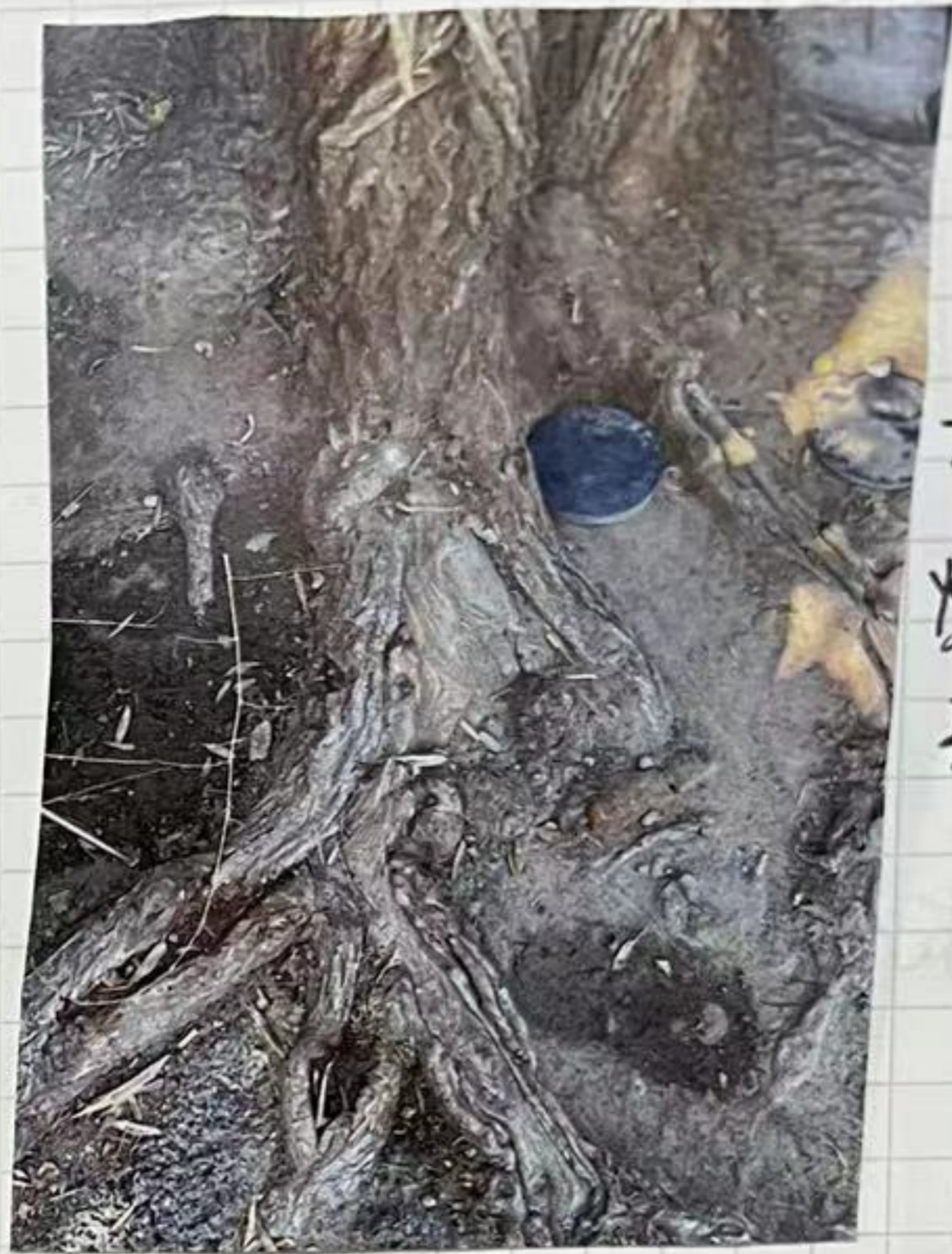
树根 爆出来 来了