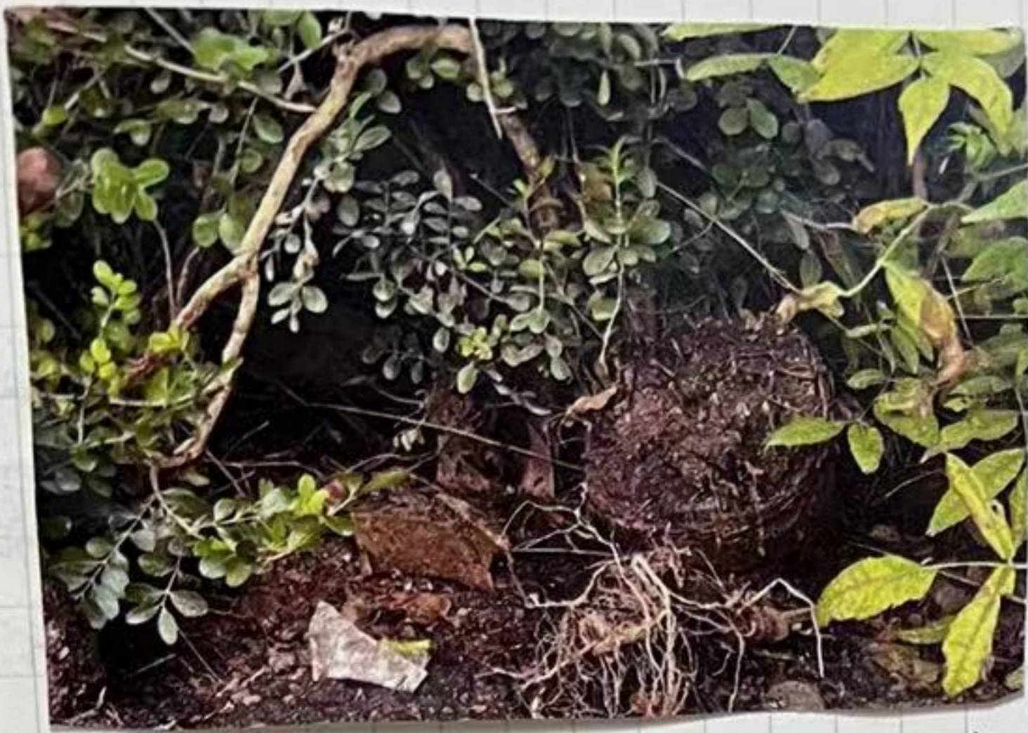
花盆的土扔在了花园里. 根长出来了.