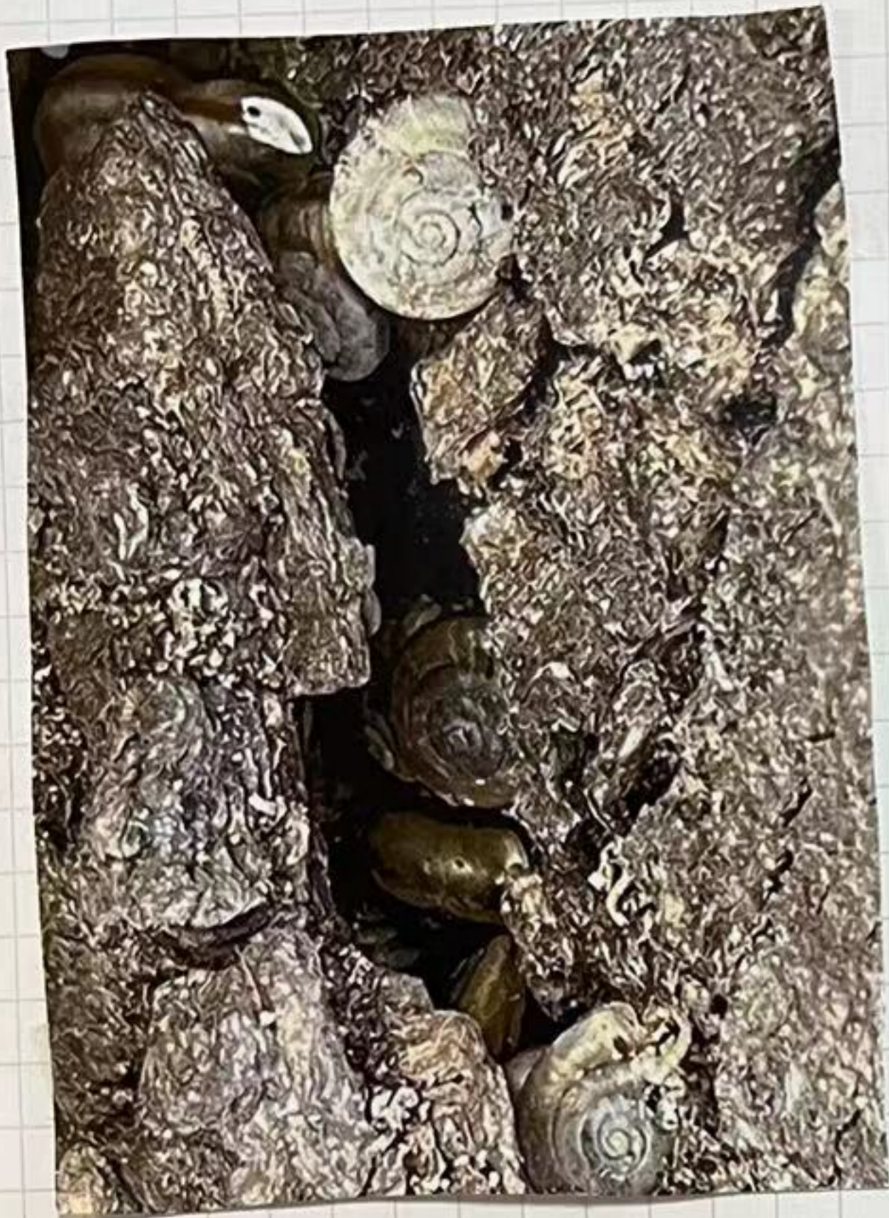
在树皮中的蜗牛们。