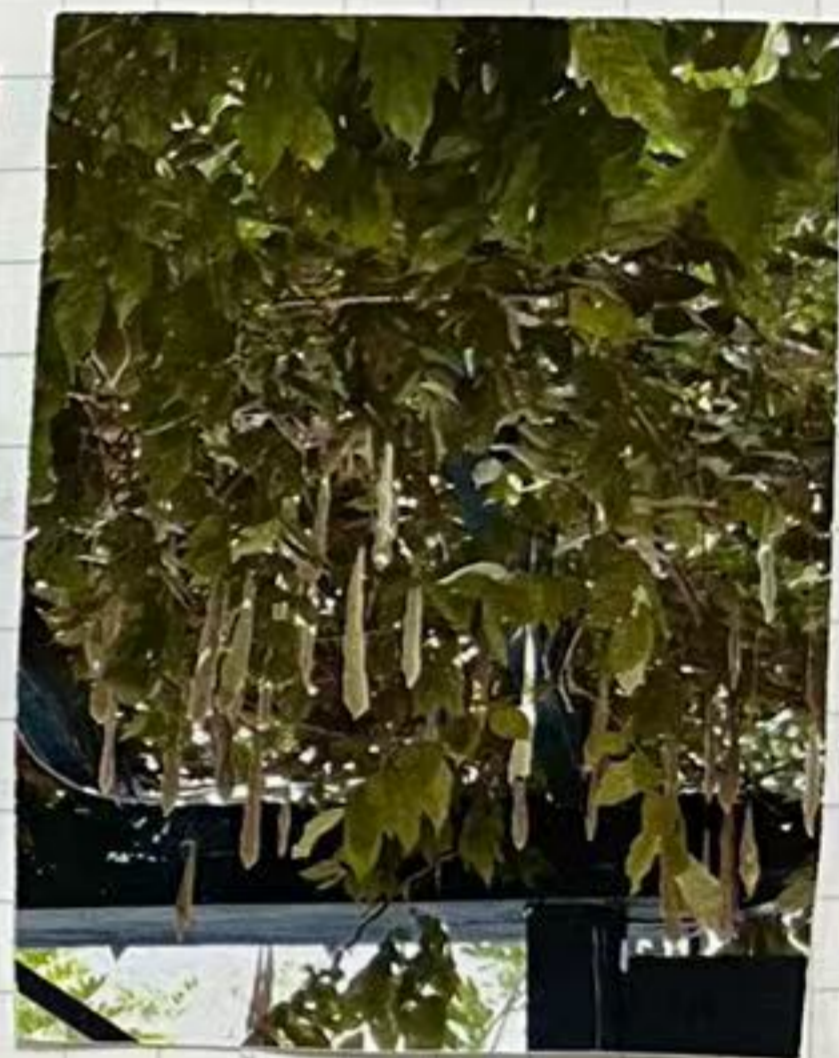
豆角和紫藤爬一起