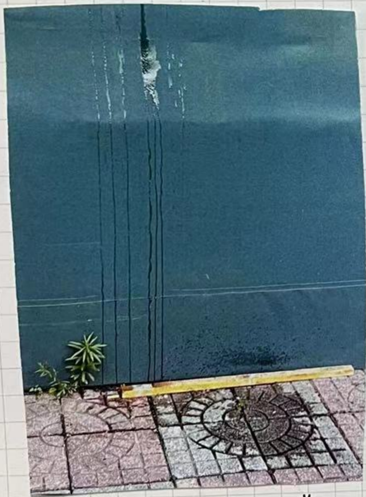
水滴下来. 地缝里的草 长出来了.